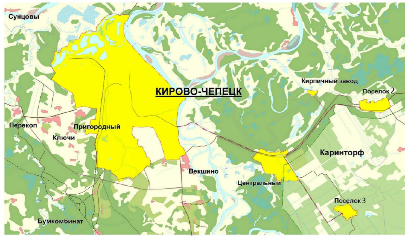
СХЕМА РАСПОЛОЖЕНИЯ ГОРОДСКОГО ОКРУГА КИРОВО-ЧЕПЕЦК (СИТУАЦИОННЫЙ ПЛАН)