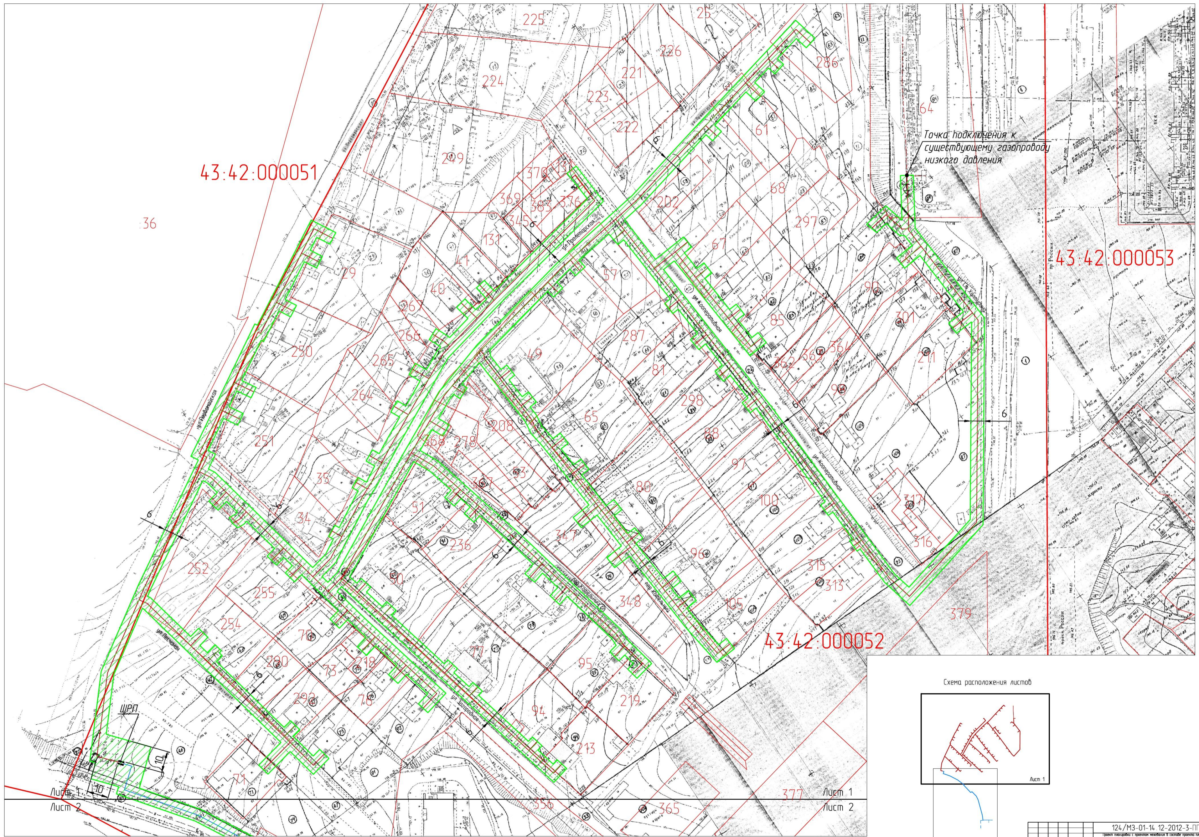
Схема расположения листов