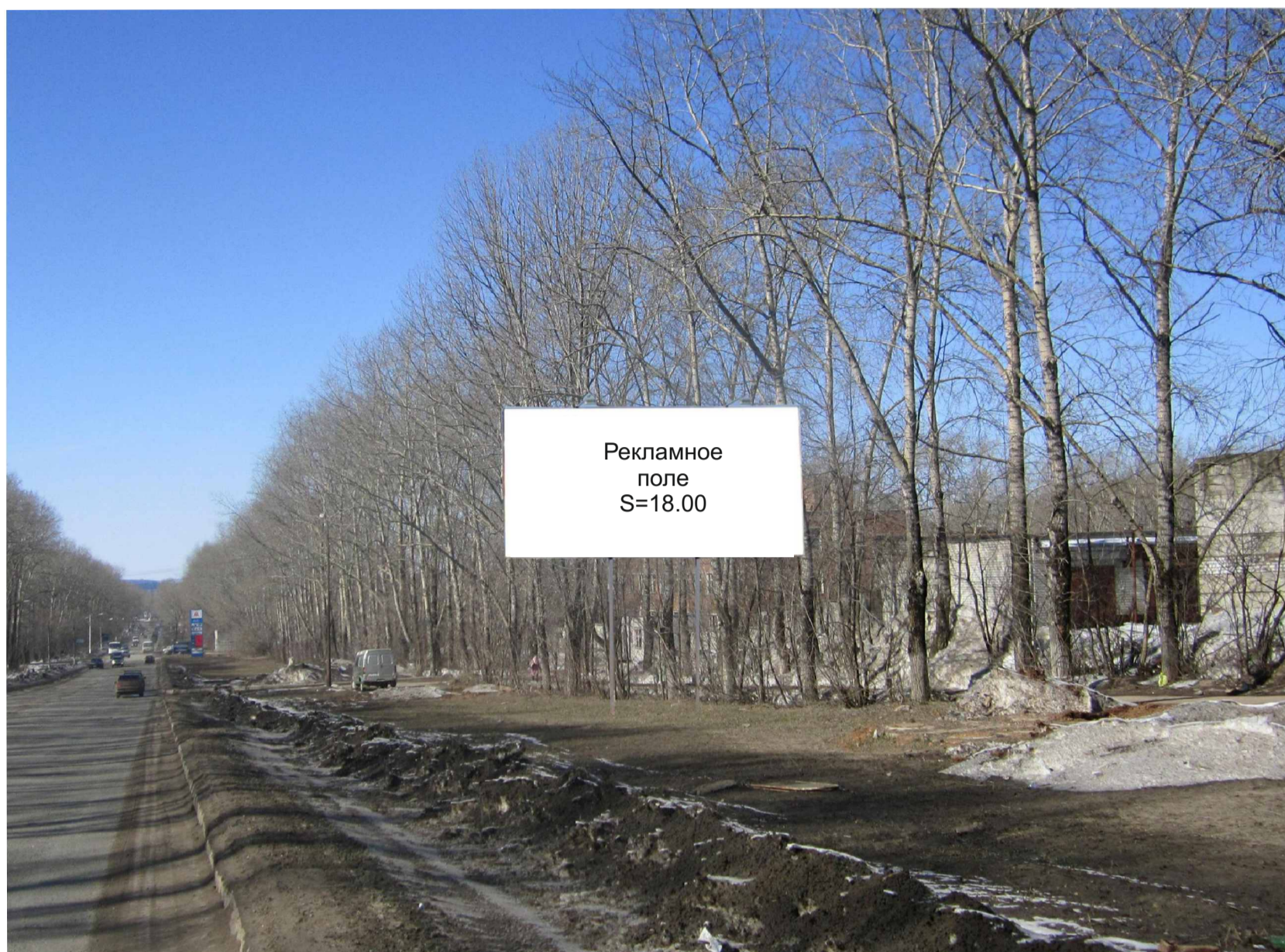
Рекламная конструкция №10 Ул. Заводская Биллборд (Вид «Б»)