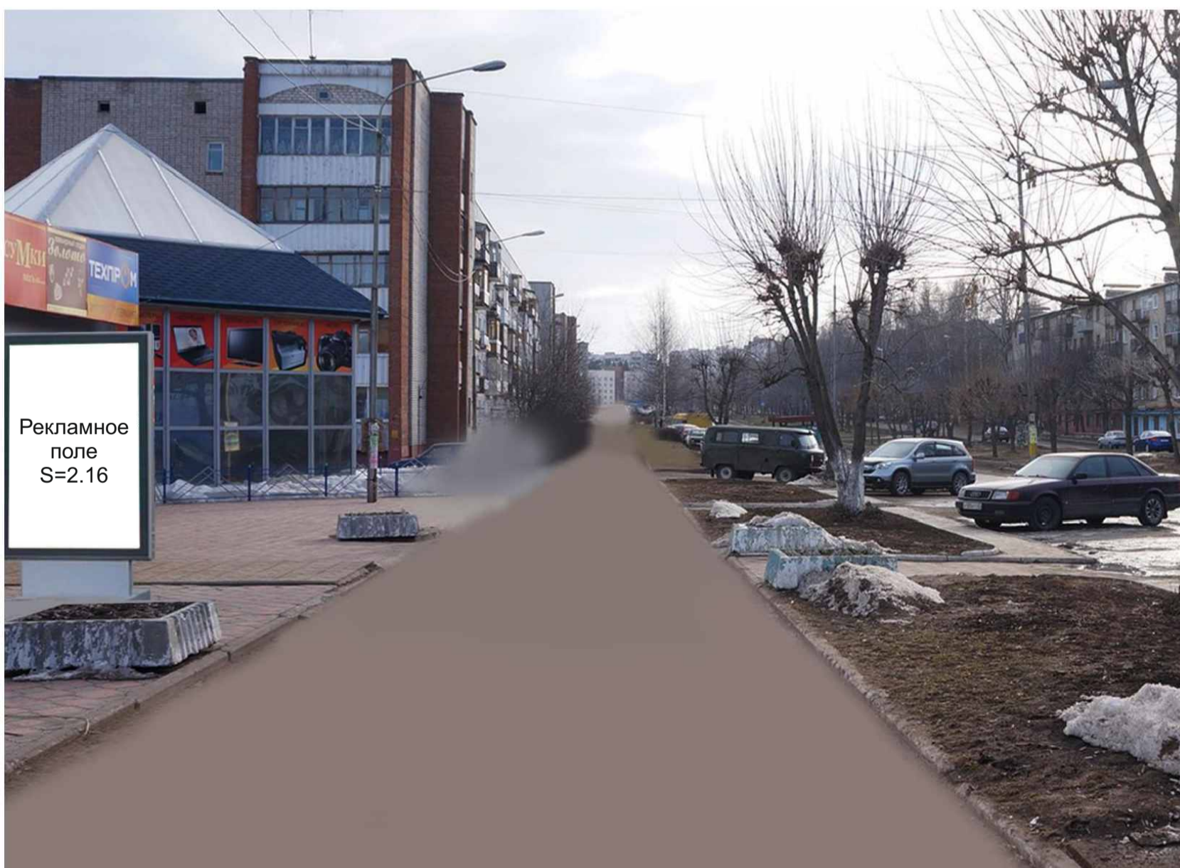
Рекламная конструкция №18 Ул. Луначарского, 9 Лайтпостер (Вид «Б»)