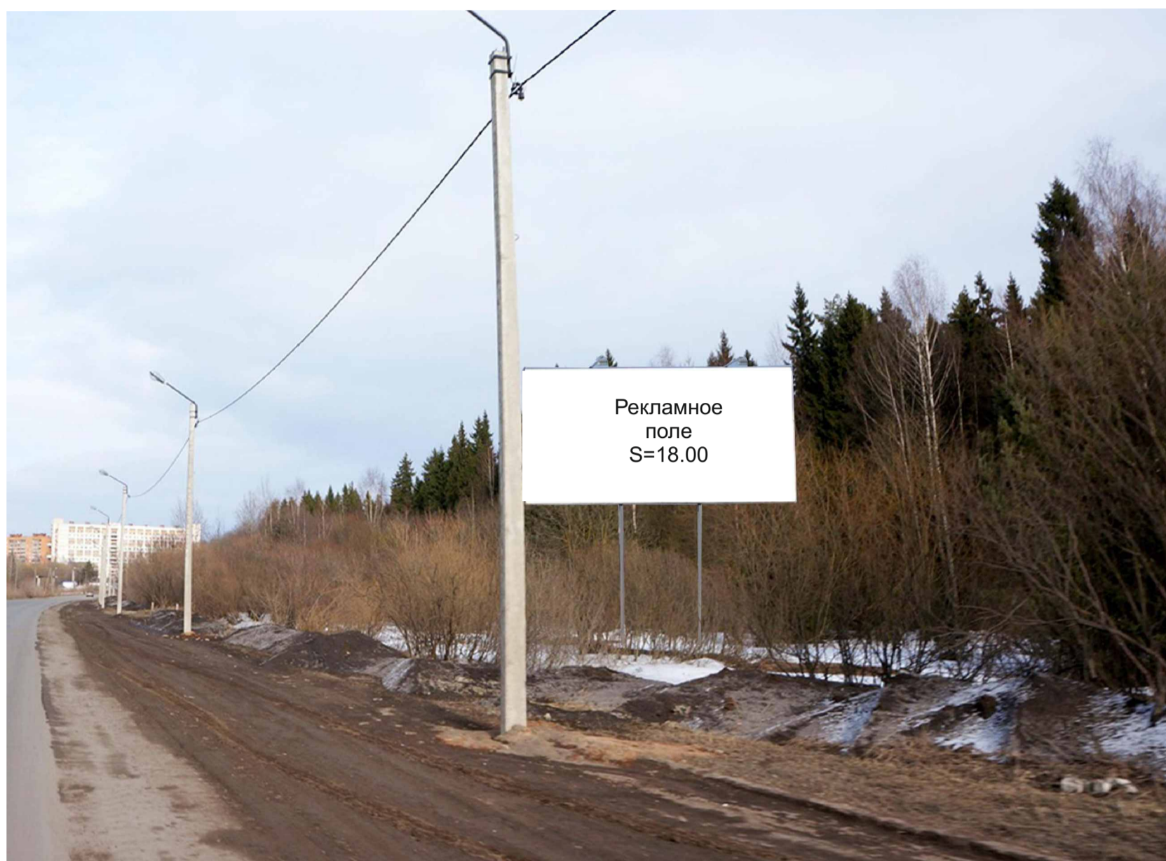
Рекламная конструкция №19 Ул. Мелиораторов Биллборд (Вид «Б»)