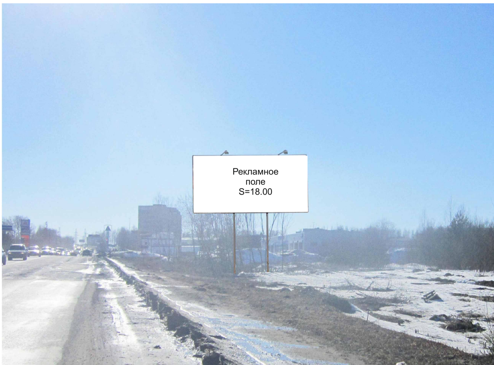
Рекламная конструкция №21 Ул. Мелиораторов Биллборд (Вид «Б»)