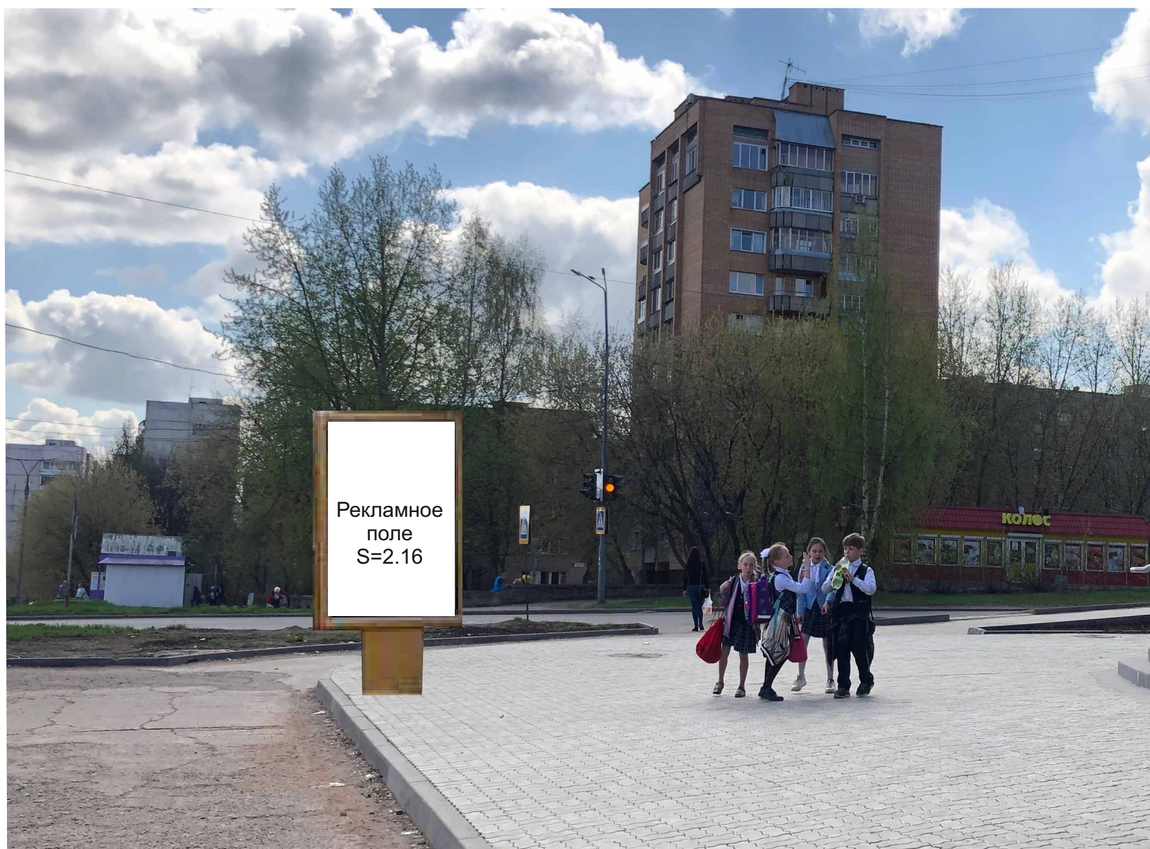
Рекламная конструкция №38 Пр-т Россия, 34 Лайтпостер (Вид «Б»)