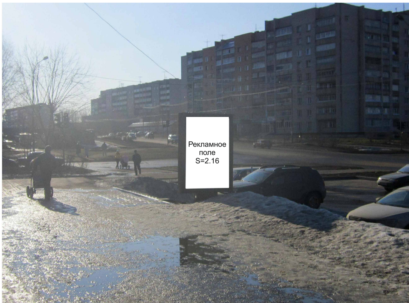
Рекламная конструкция №5 Ул. 60 лет Октября, 20 Лайтпостер (Вид «Б»)