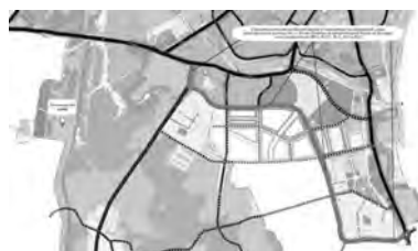
Рисунок 7. Площадка для реализации проекта «Создание логистического центра».

Проект планируется реализовать на территории промышленной площадки принадлежащей компании ООО «Никост».