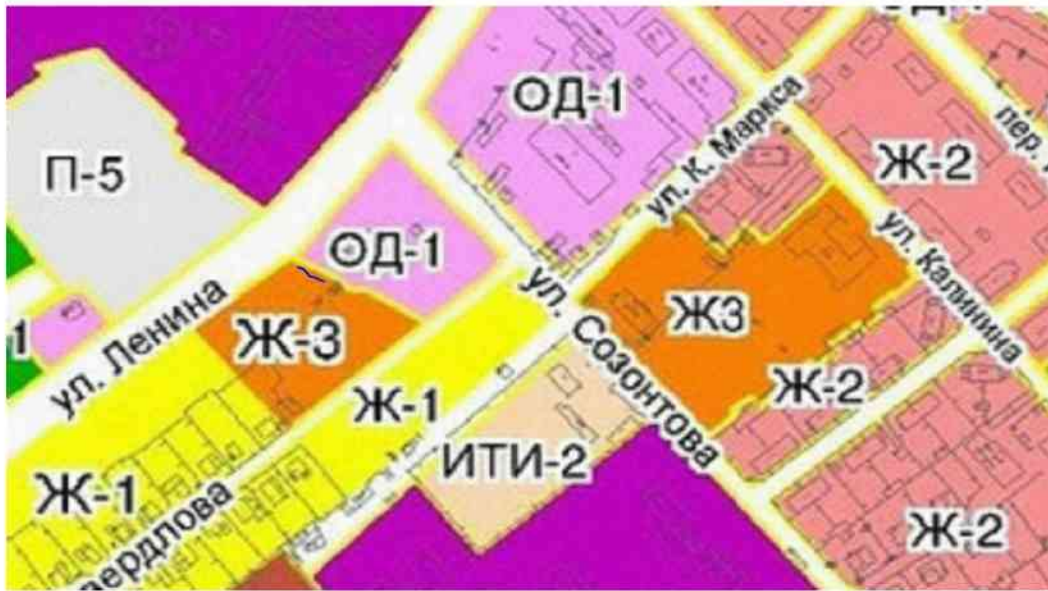
СХЕМА ИСПОЛЬЗОВАНИЯ ТЕРРИТОРИИ В ПЕРИОД ПОДГОТОВКИ ПРОЕКТА ПЛАНИРОВКИ