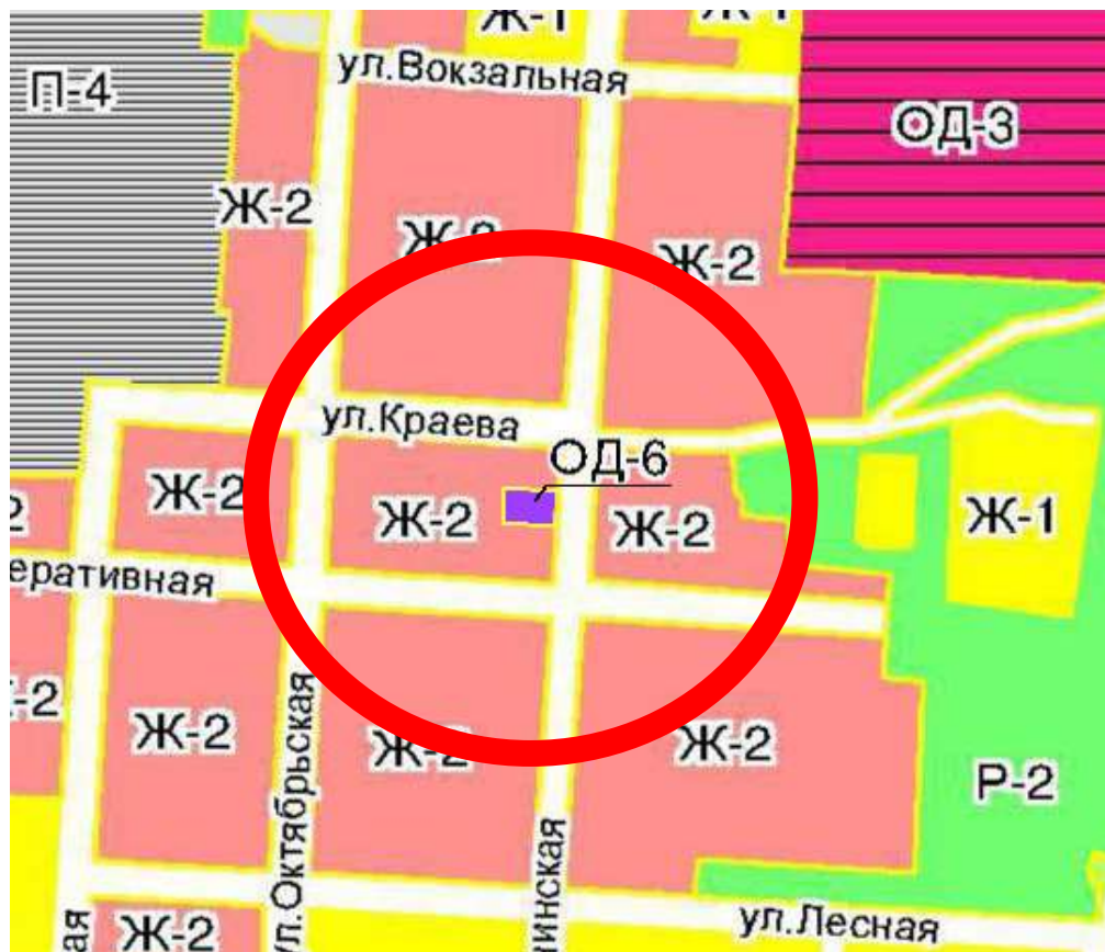
ОД-6 - зона культурных объектов и сооружений