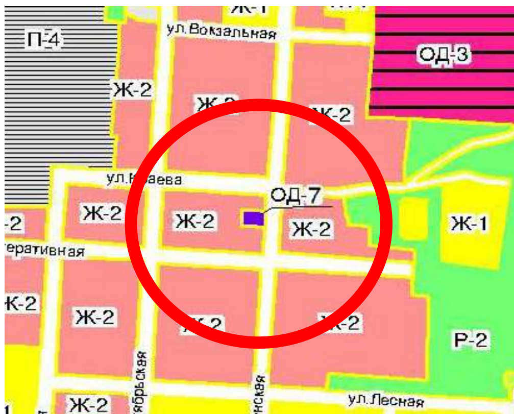
ОД-7 - зона историко-культурного и эстетического значения