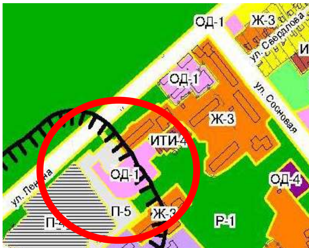
ОД-1 – зона делового, общественного и коммерческого назначения