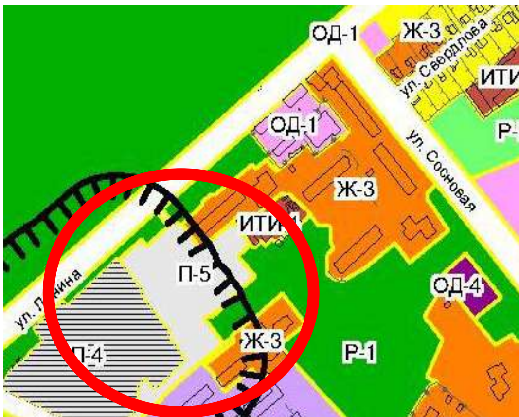
П-5 - зона предприятий V класса опасности