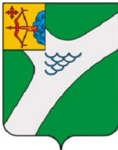
СХЕМА ТЕПЛОСНАБЖЕНИЯ МУНИЦИПАЛЬНОГО ОБРАЗОВАНИЯ «ГОРОД КИРОВО-ЧЕПЕЦК» НА ПЕРИОД 2020-2033 ГГ. (АКТУАЛИЗАЦИЯ НА 2021 ГОД)