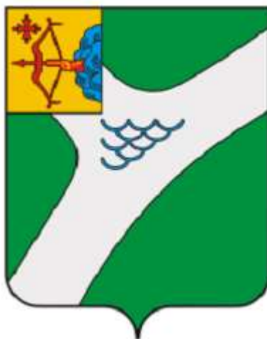
СХЕМА ТЕПЛОСНАБЖЕНИЯ МУНИЦИПАЛЬНОГО ОБРАЗОВАНИЯ «ГОРОД КИРОВО-ЧЕПЕЦК» НА ПЕРИОД 2020-2033 ГГ. (АКТУАЛИЗАЦИЯ НА 2021 ГОД)