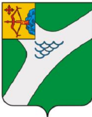
СХЕМА ТЕПЛОСНАБЖЕНИЯ МУНИЦИПАЛЬНОГО ОБРАЗОВАНИЯ «ГОРОД КИРОВО-ЧЕПЕЦК» НА ПЕРИОД 2020-2033 ГГ. (АКТУАЛИЗАЦИЯ НА 2020 ГОД)