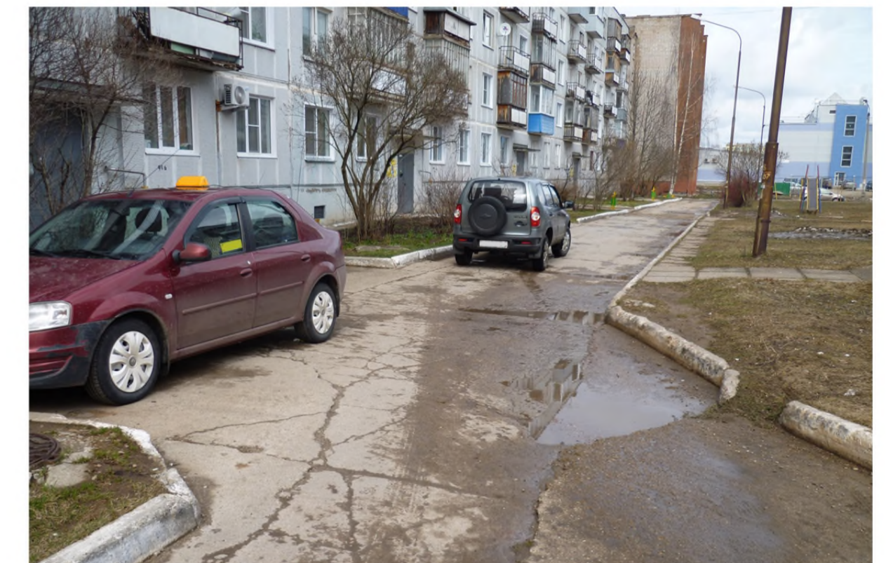
Покрытие проезда после выполнения работ