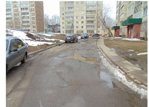
Покрытие проезда после выполнения работ