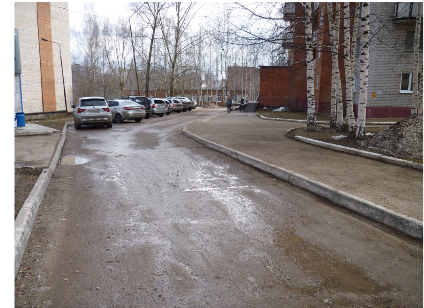
Покрытие проезда после выполнения работ

— — — — — граница придомовой территории. Существующее состояние покрытие проезда