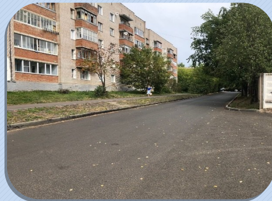
Ремонт автодороги по ул. Речной