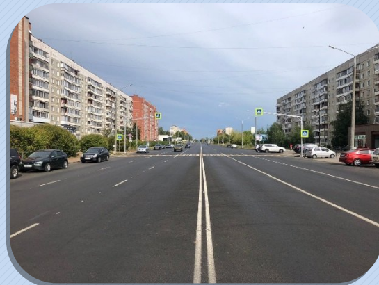
Ремонт автодороги по пр. Россия