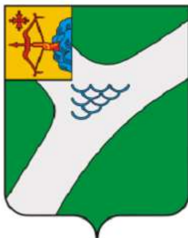
СХЕМА ТЕПЛОСНАБЖЕНИЯ МУНИЦИПАЛЬНОГО ОБРАЗОВАНИЯ «ГОРОД КИРОВО-ЧЕПЕЦК» НА ПЕРИОД ДО 2033 ГГ. (АКТУАЛИЗАЦИЯ НА 2024 Г.)