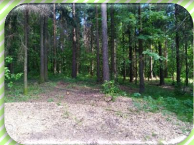
Парковая зона в районе МБОУ Лицей города Кирово-Чепецка Кировской области