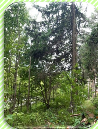
Парковая зона вдоль ул. Сосновая до д. № 7 по проезду Лесной