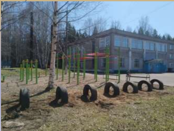
площадка с тренажерами «Юниор» ул. Спортивная