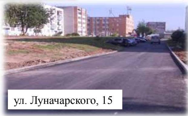
ул. Луначарского, 15