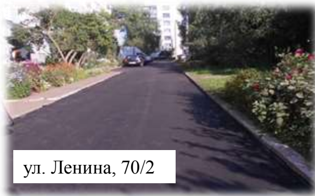
ул. Ленина, 70/2