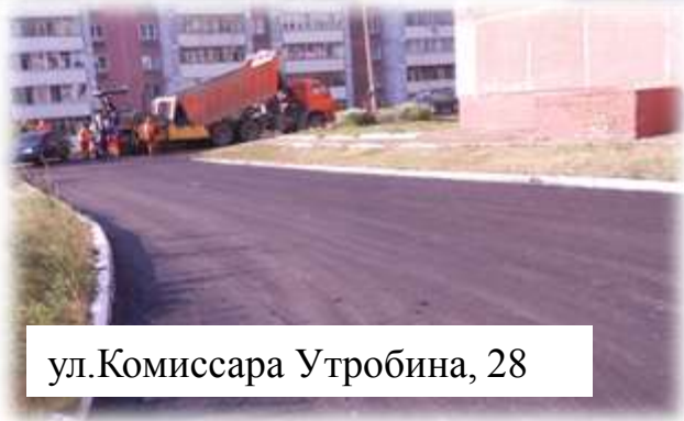
ул. Комиссара Утробина, 28