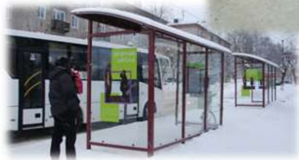
Благоустройство остановочных пунктов в «исторической» части города