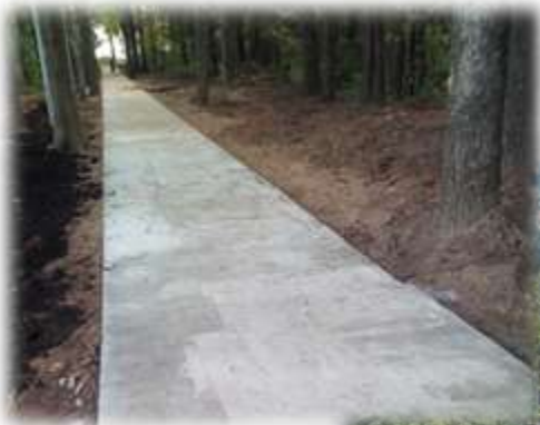
Комплексное благоустройство городского парка