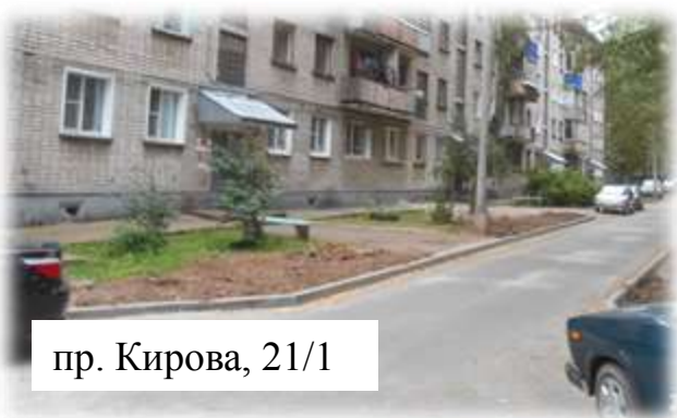
пр. Кирова, 21/1