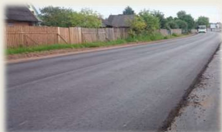
Дорога на городское кладбище