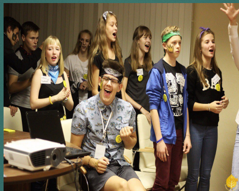
Лагерь актива старшеклассников СТАРТ