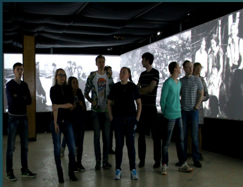
Мультимедийная выставка «ЖИЗНЬ»