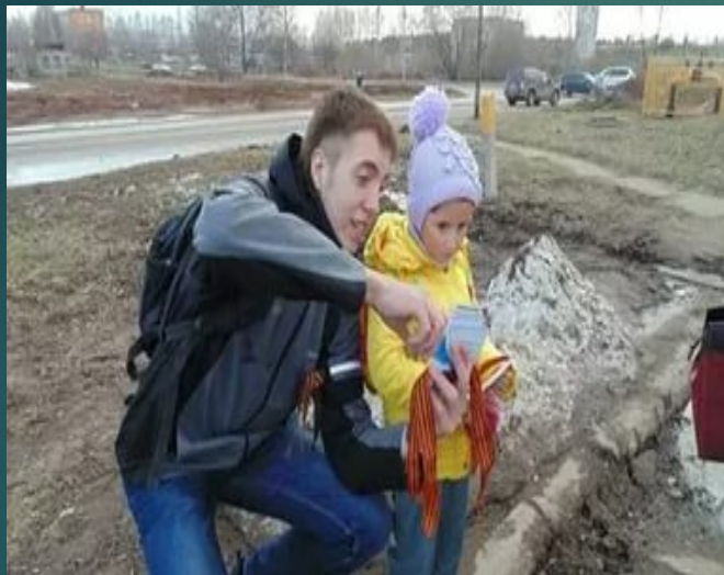
Акция «Георгиевская ленточка»