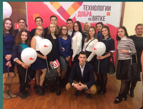
Региональный добровольческий форум