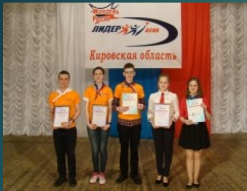
Городской конкурс Лидер 21 века