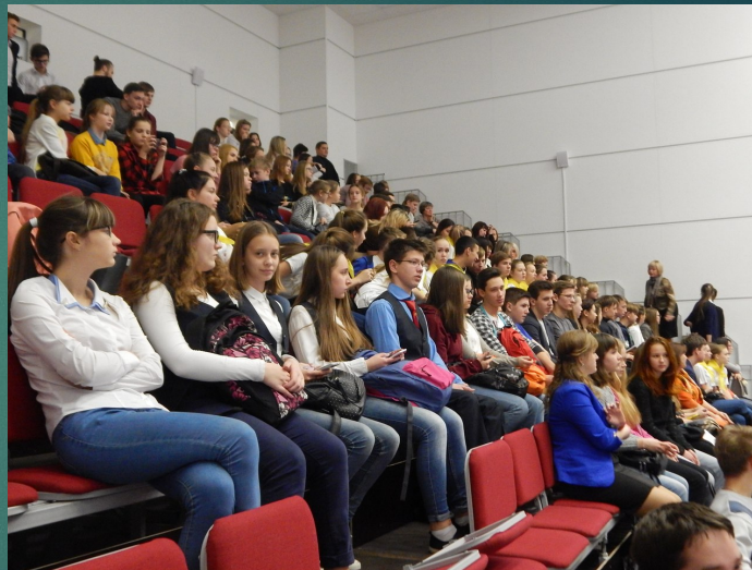
Добровольческий форум школьников