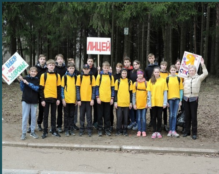
Легкоатлетический кросс «Здоровью – ДА! Курению – НЕТ!»