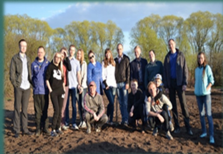
АКЦИЯ «Сады Победы»