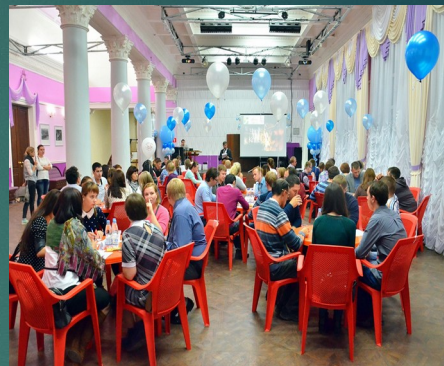
ЧТО? ГДЕ? КОГДА?