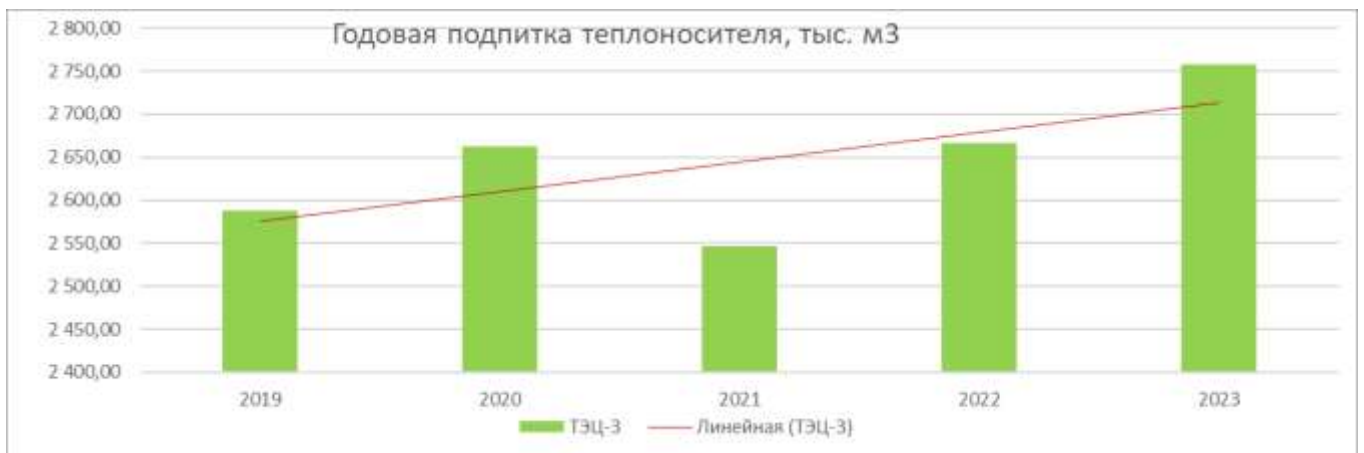
Рисунок 6.2. Фактическая подпитка по ТЭЦ-3 за период 2019-2023 гг.