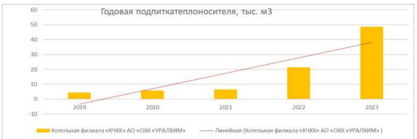
Рисунок 6.4. Фактическая подпитка по Котельной филиала «КЧХК» АО «ОХК «УРАЛХИМ» за период 2019-2023 гг.

Как видно из рисунков 6.1-6.4, величина подпитки имеет тенденцию к росту. На ТЭЦ-3 Филиала «Кировского» ПАО «Т Плюс» и на Котельной филиала «КЧХК» АО «ОХК «УРАЛХИМ» при отсутствии значительной подключенной застройки в период с 2021-2023 гг, наблюдается рост подпитки, что косвенно является следствием недостаточности темпов замены ветхих тепловых сетей и «открытой» системы ГВС.