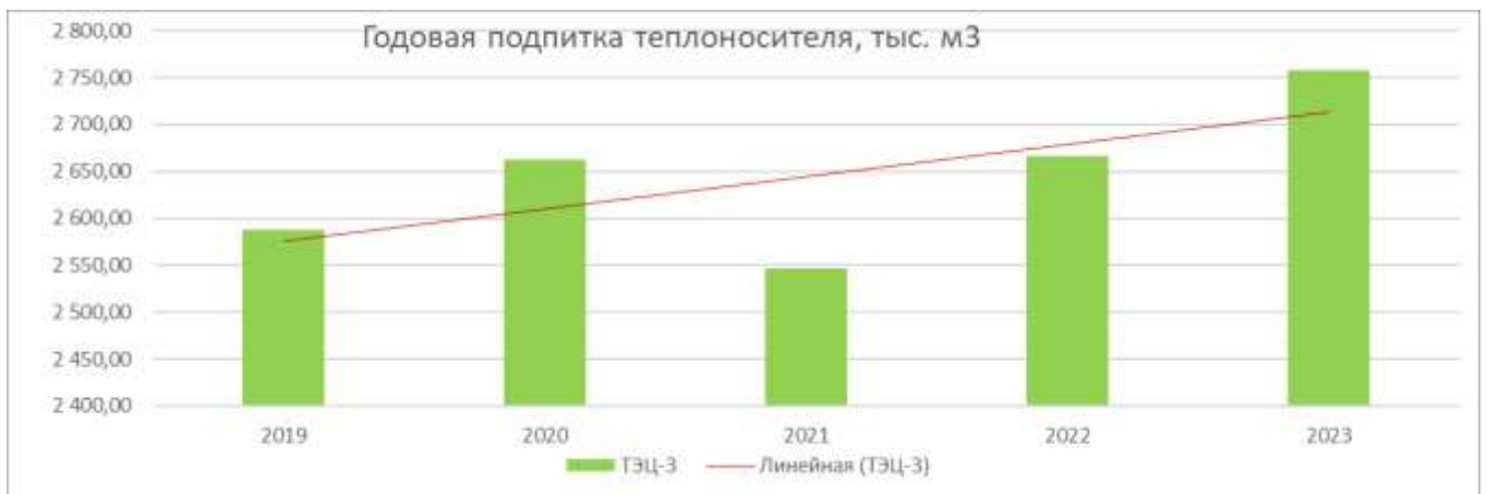
Рисунок 6.2. Фактическая подпитка по ТЭЦ-3 за период 2019-2023 гг.