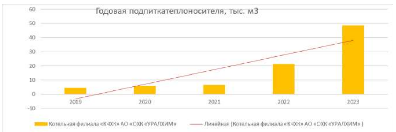
Рисунок 6.4. Фактическая подпитка по Котельной филиала «КЧХК» АО «ОХК «УРАЛХИМ» за период 2019-2023 гг.

Как видно из рисунков 6.1-6.4, величина подпитки имеет тенденцию к росту. На ТЭЦ-3 Филиала «Кировского» ПАО «Т Плюс» и на Котельной филиала «КЧХК» АО «ОХК «УРАЛХИМ» при отсутствии значительной подключенной застройки в период с 2021-2023 гг, наблюдается рост подпитки, что косвенно является следствием недостаточности темпов замены ветхих тепловых сетей и «открытой» системы ГВС.