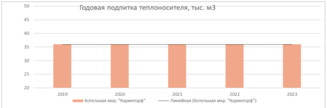
Рисунок 6.3. Фактическая подпитка по Котельной «Каринторф» за период 2019-2023 гг.