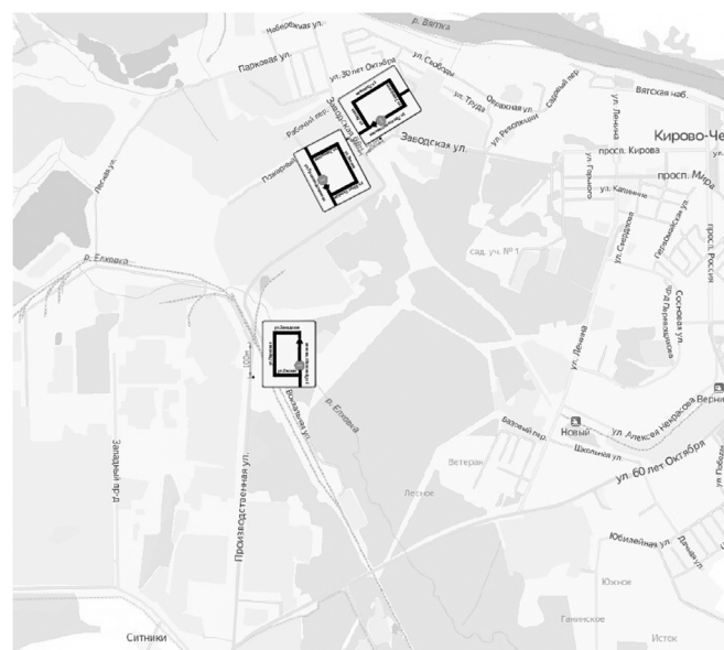
Схема размещения дорожных знаков 6.17 «Схема объезда»

Утверждено постановлением администрации муниципального образования «Город Кирово-Чепецк» Кировской области от 28.07.2021 № 784