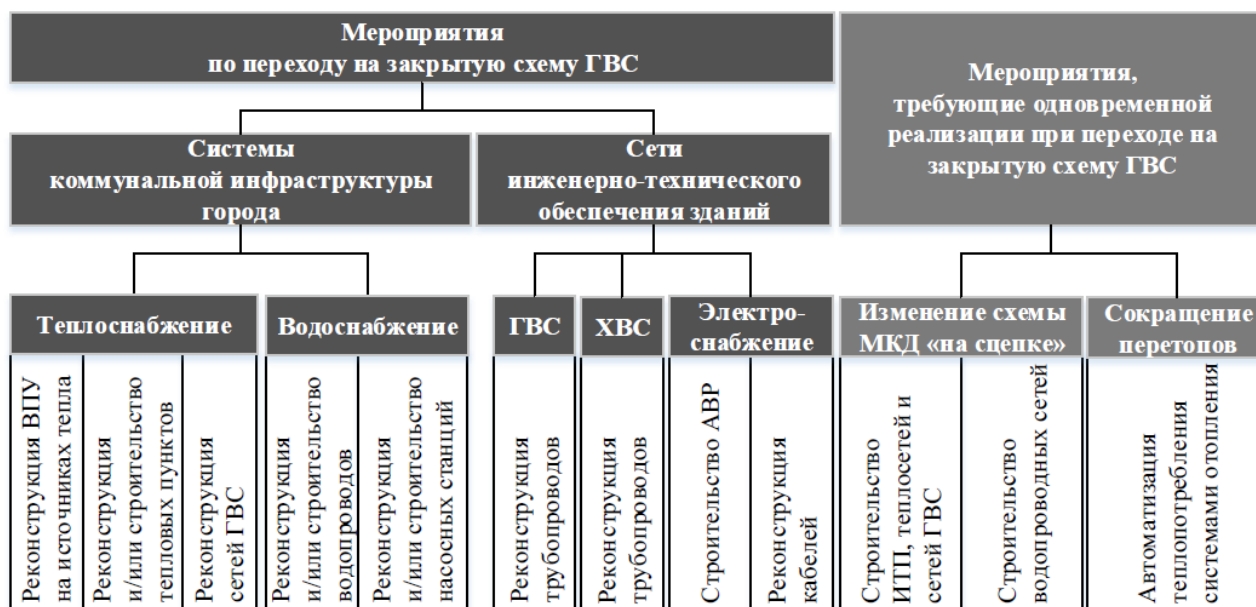
Рисунок 1 – Оценка мероприятий по переводу потребителей на закрытую схему

Перечисленные работы по переходу на закрытую схему ГВС и мероприятия на смежных инженерных системах, в том числе внутридомовых показывает рисунок ниже.