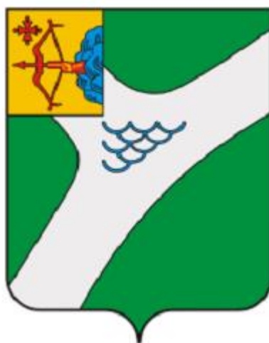
СХЕМА ТЕПЛОСНАБЖЕНИЯ МУНИЦИПАЛЬНОГО ОБРАЗОВАНИЯ «ГОРОД КИРОВО-ЧЕПЕЦК» НА ПЕРИОД ДО 2033 Г. (АКТУАЛИЗАЦИЯ НА 2023 ГОД)