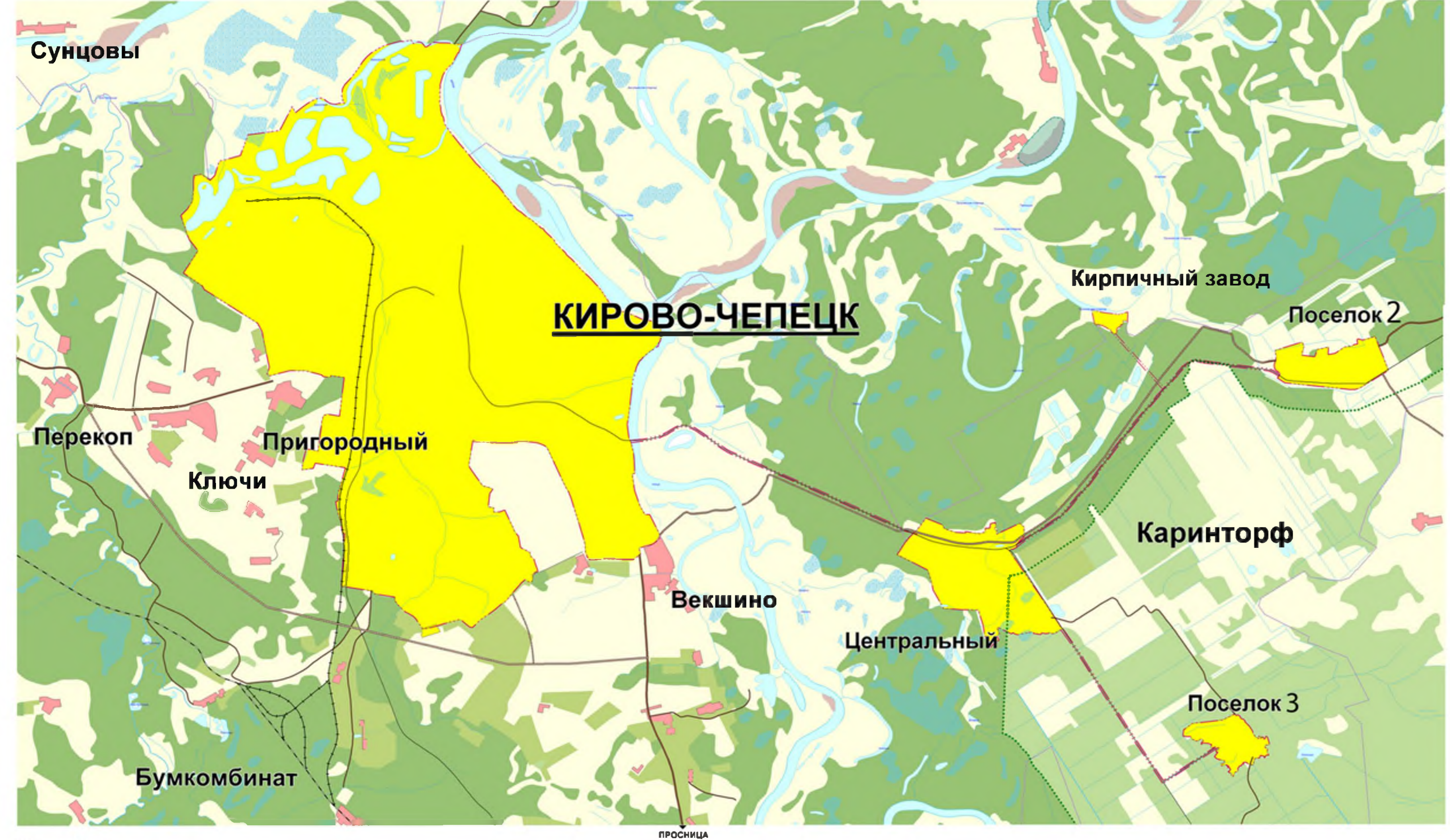
СХЕМА РАСПОЛОЖЕНИЯ ГОРОДСКОГО ОКРУГА КИРОВО-ЧЕПЕЦК (СИТУАЦИОННЫЙ ПЛАН)