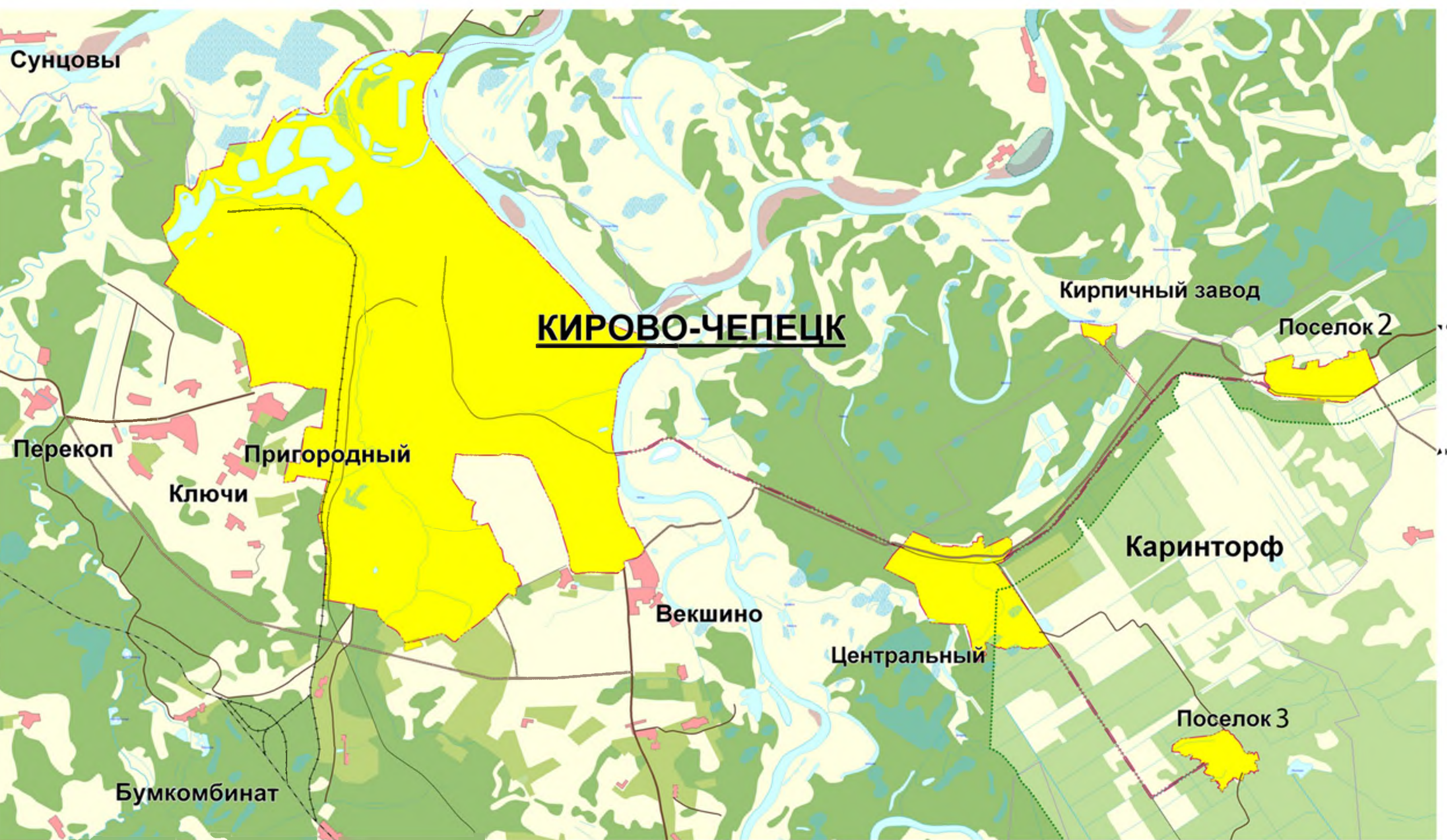
СХЕМА РАСПОЛОЖЕНИЯ ГОРОДСКОГО ОКРУГА КИРОВО-ЧЕПЕЦК (СИТУАЦИОННЫЙ ПЛАН)