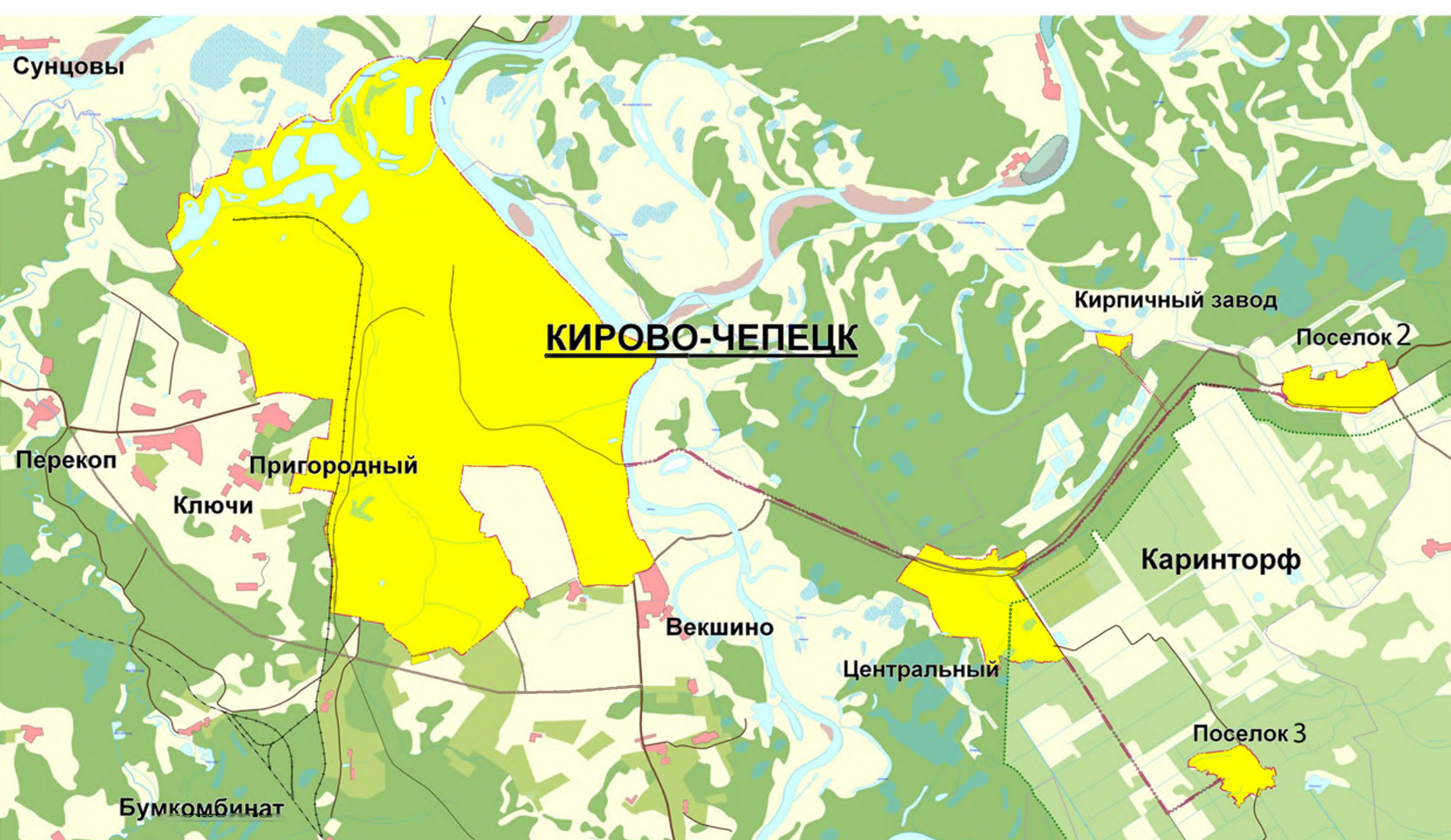
СХЕМА РАСПОЛОЖЕНИЯ ГОРОДСКОГО ОКРУГА КИРОВО-ЧЕПЕЦК (СИТУАЦИОННЫЙ ПЛАН)