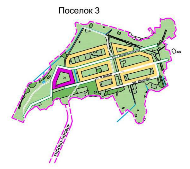
Схема расположения границ городского округа "Город Кирово-Чепецк"