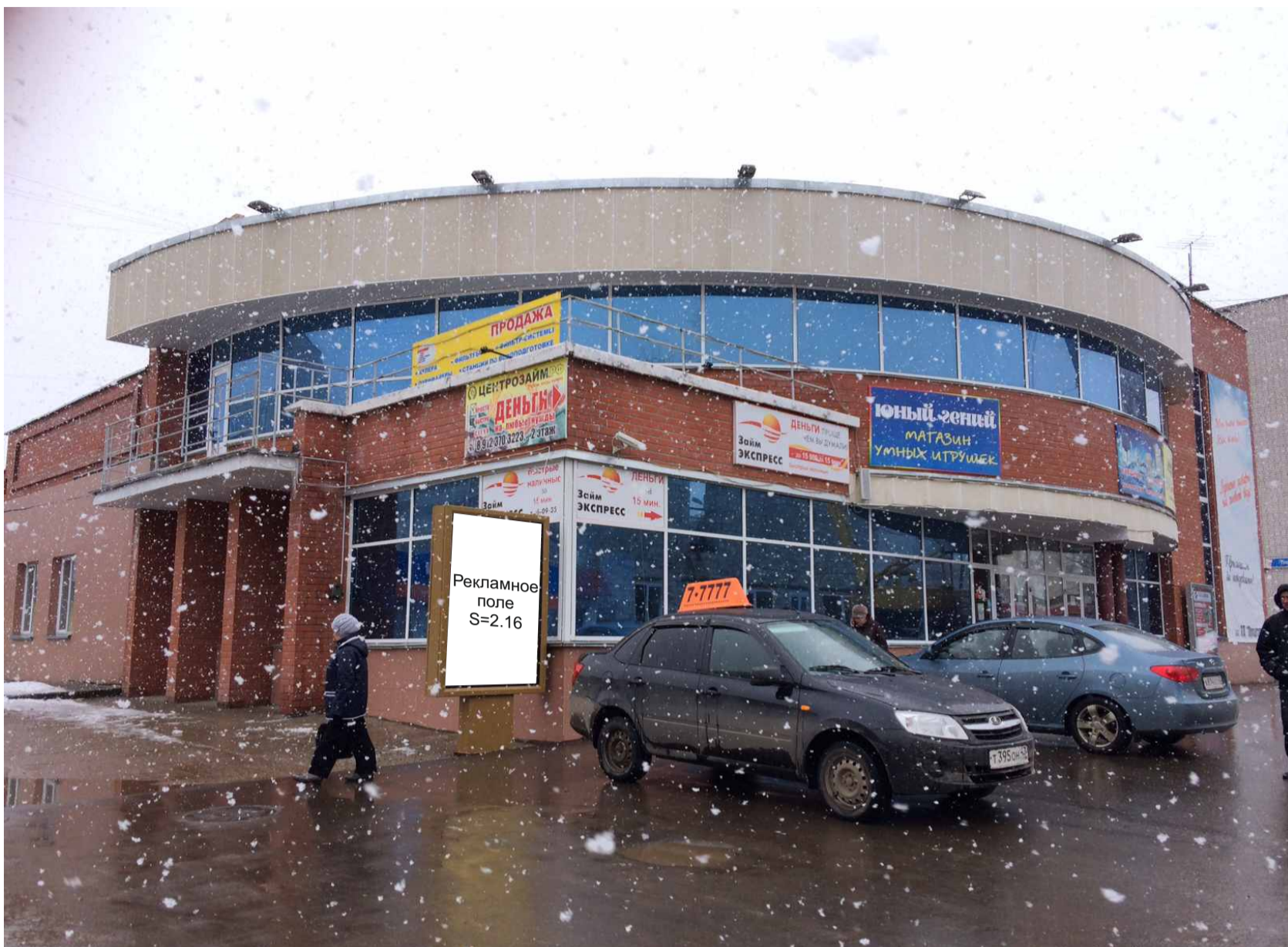
Рекламная конструкция №3 Ул. 60 лет Октября, 6 Лайтпостер (Вид «Б»)