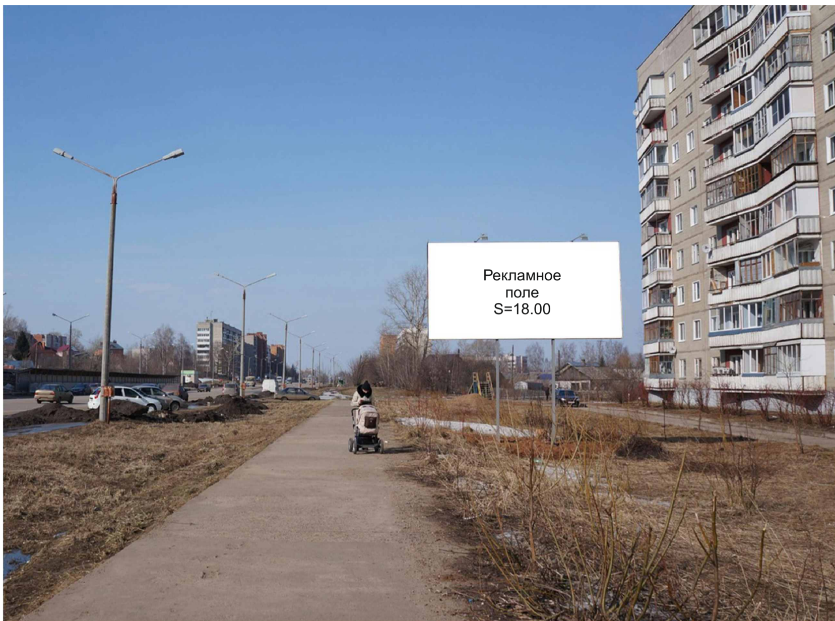
Рекламная конструкция №37 Пр-т Россия, 27 Биллборд (Вид «Б»)