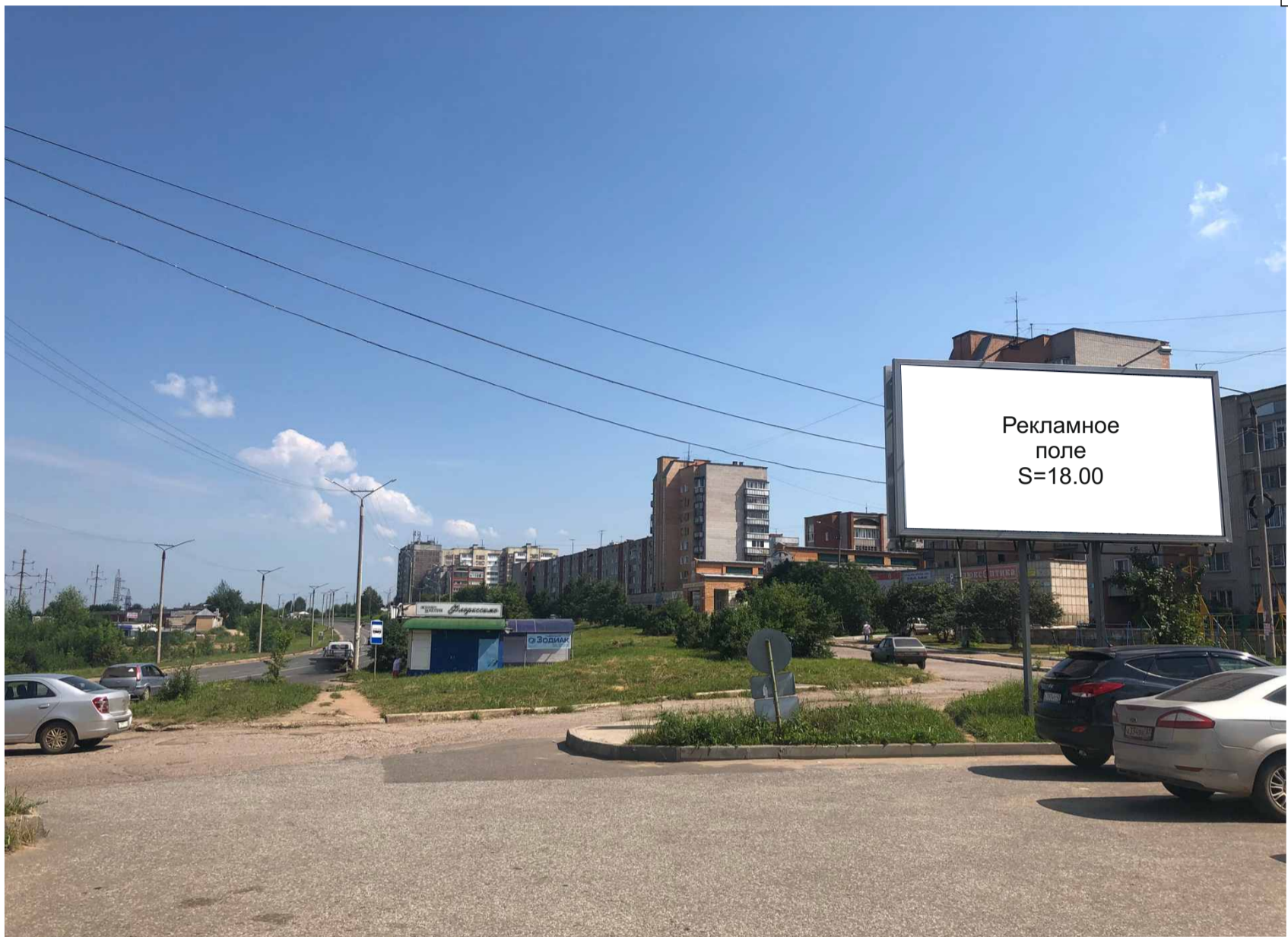
Рекламная конструкция №4 Ул. 60 лет Октября, 20 Биллборд (Вид «Б»)